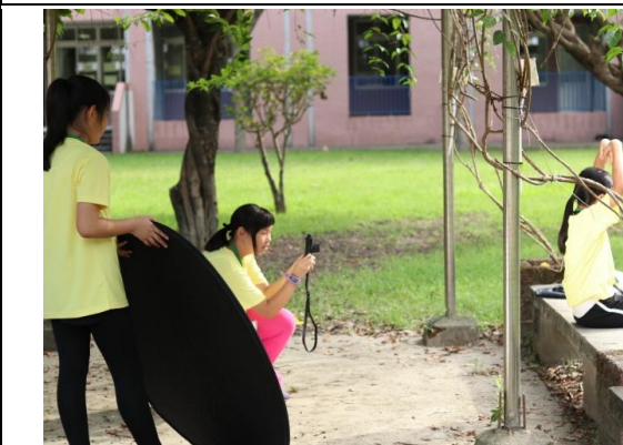
說明/暑假:設計群-攝影達人