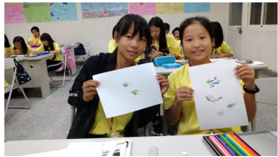
說明/暑假:設計群-個性品牌設計