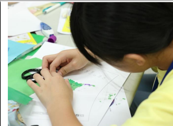
說明/暑假:設計群-色彩與設計