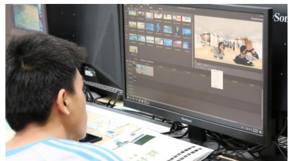
說明/設計群-威力導演