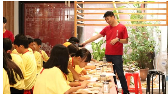
說明/暑假:產業參訪-新味醬油