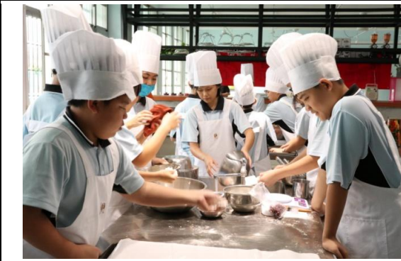
說明/食品群-莓茶暖心(莓果司康+飲料調製)