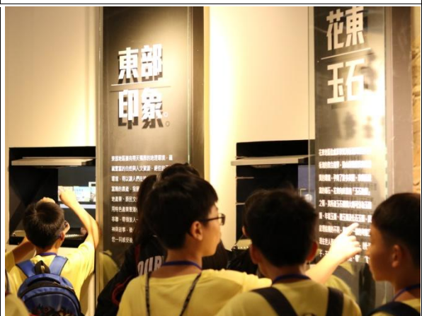
說明/暑假:產業參訪-後山山後故事館