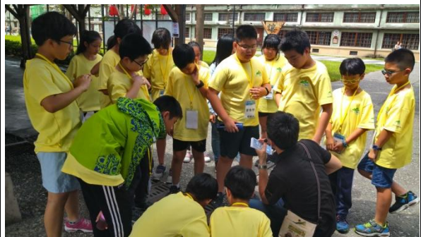
說明/暑假:產業參訪-文創園區