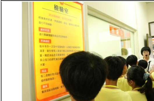
說明/暑假:產業參訪-香又香便當