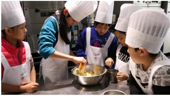
說明/寒假:食品群-莓茶暖心