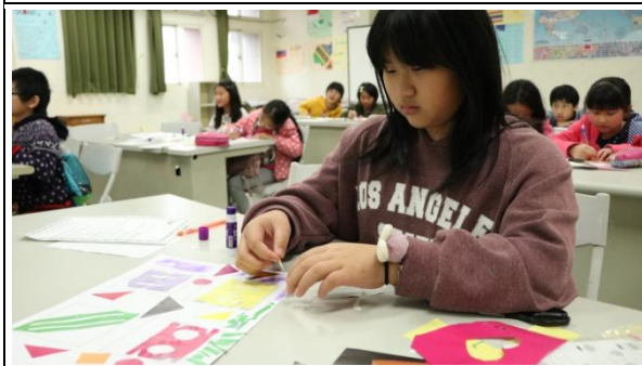
說明/寒假:設計群-創意大考驗