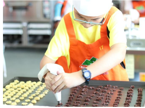
說明/暑假:食品群-丹麥小西餅