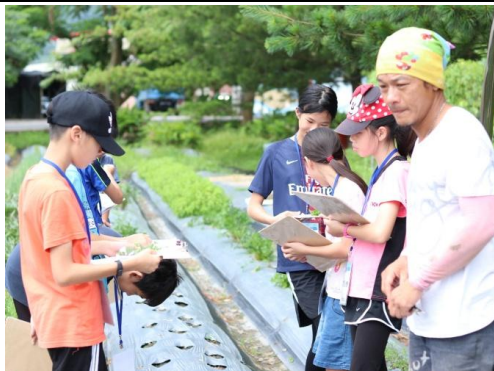
說明/暑假:產業參訪-禾亮家香草農場