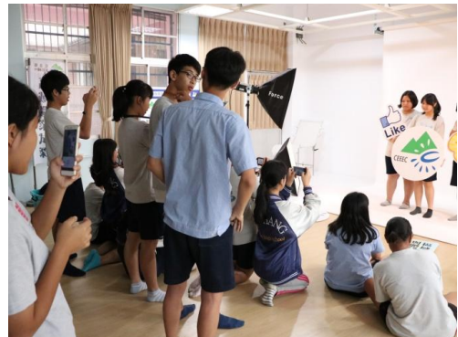
說明/設計群-攝影達人