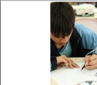
說明/設計群-個性品牌設計