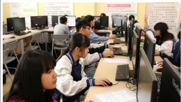
說明/寒假:設計群-影像製作