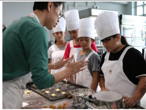
說明/食品群-浴火鳳凰(鳳梨酥)