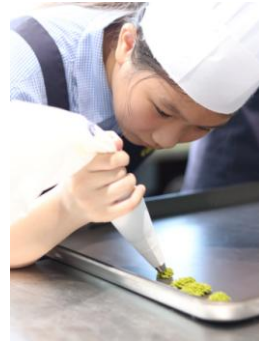
說明/食品群-童話王國(丹麥小西餅)