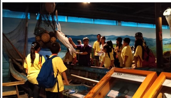
說明/暑假:產業參訪-玩味蕃樂園