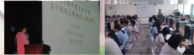
辦理適性入學免試入學宣導