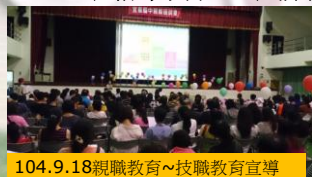
104.9.18親職教育~技職教育宣導