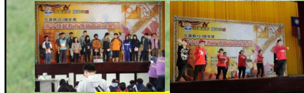
參加全縣技職博覽會104.3.12