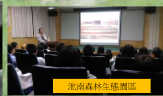
池南森林生態園區