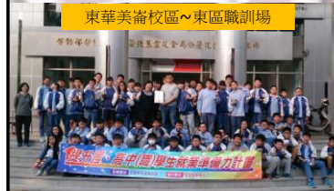
東華美崙校區~東區職訓場