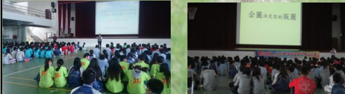
高中職均質化宣導(104.12.23) 辦理提升國高中職就業準備力講座 (104.11.11)