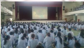
104.08.28 十二年國教影片欣賞~ 最珍貴的禮物