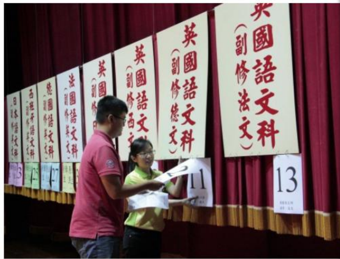
五專優先免試入學，明年試辦電腦填志願，一改傳統的撕榜方式。圖為文藻外語大學五專撕榜畫面。

2017-07-31 23:36 聯合報 記者馮靖惠／台北報導 讚 3 分享 傳送